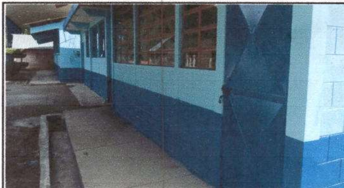
Foto 2: Finalización de la pintura en el Edificio educativo en sus paredes interiores y exteriores. Equivalente a 318 mts.