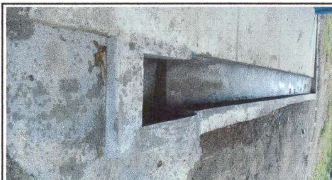
Foto 3: Cunetas reparadas en un cien por ciento. Cantidad 36 metros.