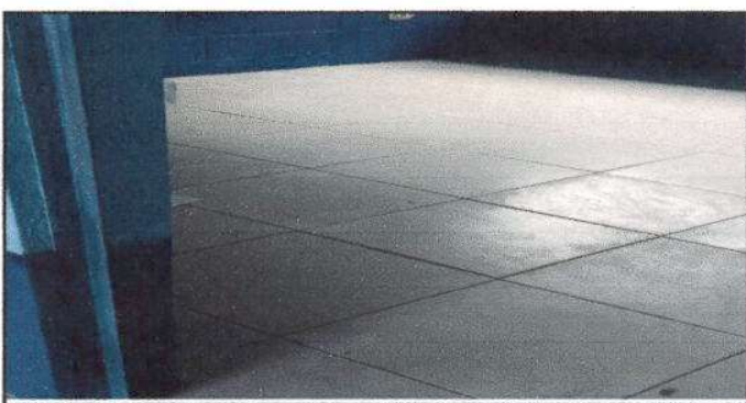
Foto 5: Piso instalado en un cien por ciento en dos aulas y la dirección del establecimiento educativo, equivalente a 165 metros cuadrados.