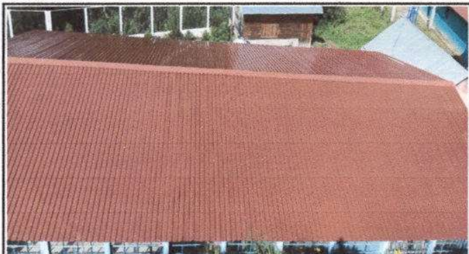
Foto1: Lamina troquelada alucinc calibre 26 instalada en el techo de la escuela. Medidas: 21mts. Largo por 11.5 de hancho equivalente a 42 laminas en total.